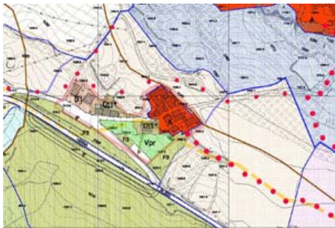
Piano strutturale Comune di Chiusi area tutela paesistica degli aggregati

Il Piano Strutturale del Comune di Chiusi della Verna recepisce il sistema della tutela paesistica degli aggregati del PTC relative all'ambito territoriale interessato dall'intervento, e una porzione di territorio viene classificata come zona A . A tal proposito è opportuno sottolineare che il Piano di Recupero, all'interno di tale area non prevede interventi di ristrutturazione urbanistica o di modifica del sistema dei percorsi e dell'impianto esistente.